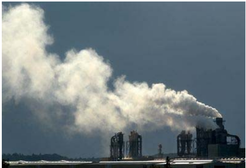
Contaminación atmosférica industrial

Las cantidades de emisiones de contaminantes industriales cada vez son mayores. Los gases de efecto invernadero producen el calentamiento de la superficie terrestre habitable. El capitalismo no solamente altera el clima sino las condiciones generales para la vida en el planeta.